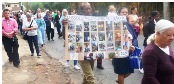
Caminhada de encerramento

Cipotânea, Paula Cândido, Congonhas, Senhora de Oliveira e Canaã. Dez irmãs e um irmão carmelita também estiveram nas comunidades, falando do amor de Deus.