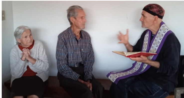
Comunidade São Geraldo

Nesse empreendimento, a paróquia contou com o trabalho de dezenas de paroquianos e de missionários/as vindos de Oratórios, São Domingos, Abre Campo,