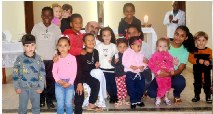
Comunidade São Judas