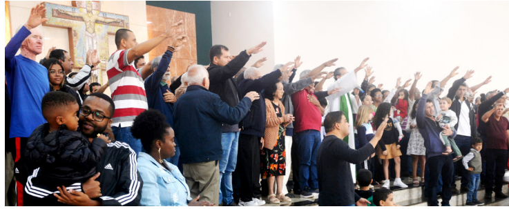
Pais recebem bênção especial na missa do seu dia

Celebrada há mais de 30 anos (desde 1992), essa semana é uma oportunidade para as pessoas se aproxi-