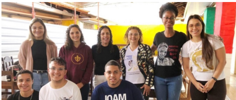
Jovens missionários, professoras e especialistas na Escola Pe. Álvaro

Para celebrar o Dia do Estudante (11/08), uma das principais atividades do Ano Missionário da Paróquia São João Batista foi a visita a escolas da educação básica de Viçosa, de 05 a 09 de agosto.