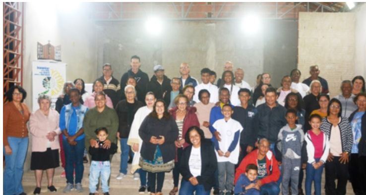
Comunidade Santa Luzia